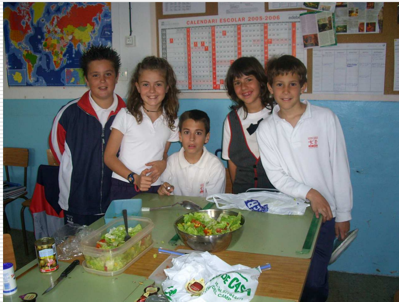
Taller de cuina