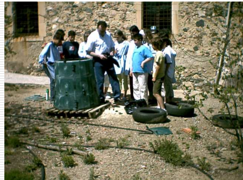
Planta de compostatge